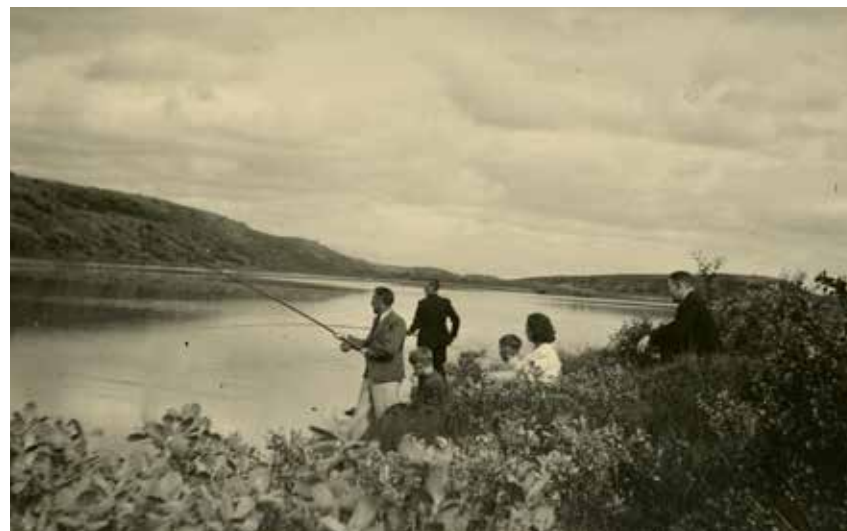
Stangveiði í Eiðavatni. 70-5642.

Í upphafi verkefnisins var ákveðið að samræma verkferla við skönnun, litgreiningu og skráningu á skjalasöfnunum þremur. Myndir eru skannaðar inn í 300 punkta upplausn í stærðinni 210 x 297 mm (A4). Skráarformið er Tiff og eru allar myndir