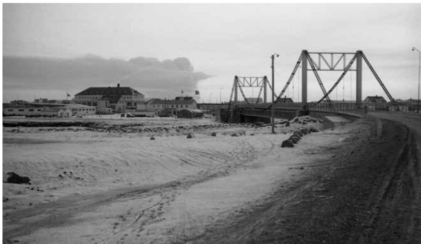
Selfoss, séð yfir Ölfusárbrú og miðbæinn, gömlu Kaupfélagssmíðjurnar, pósthúsið, Ráðhúsið og Tryggvaskáli sjást. Í fjarska sést mökkur úr Surteyjargosinu 1963. 2010_TJ_00265.

Aðventusýning Héraðsskjalasafns Árnesinga veur jafnan eftirtekt, en sýningin er útsýning fyrir utan Ráðhús Sveitarfélagsins Árborgar. Eins og undanfarin ár hefur afrakstur ljósmyndaverkefnisins verið kynntur á sýningunni og hún er nú fastur hluti af þeirri menningardagskrá sem íbúum er boðið upp á í desember ár hvert. Vefurinn myndasetur.is hefur verið í þróun allt árið til að bæta enn frekar leitarbærni og svartíma/hraða. Mikil aðsókn hefur verið að vefnum allt frá byrjun, og fjölmargir aðilar í ferðapjónustu og útgáfu hafa nýtt sér myndir af vefnum með ýmsum hætti. Á Safnahelginni á Suðurlandi 1.-3. nóvember 2013 voru 15.000 ljósmyndir settar á vefinn. Ætlunin er að setja 20.000 myndir til viðbótar á vefinn í tengslum við Menningarmánuðinn október hjá Sveitarfélaginu Árborg og Safnahelgina á Suðurlandi. Þá verða samtals 80.000 ljósmyndir á vefnum.