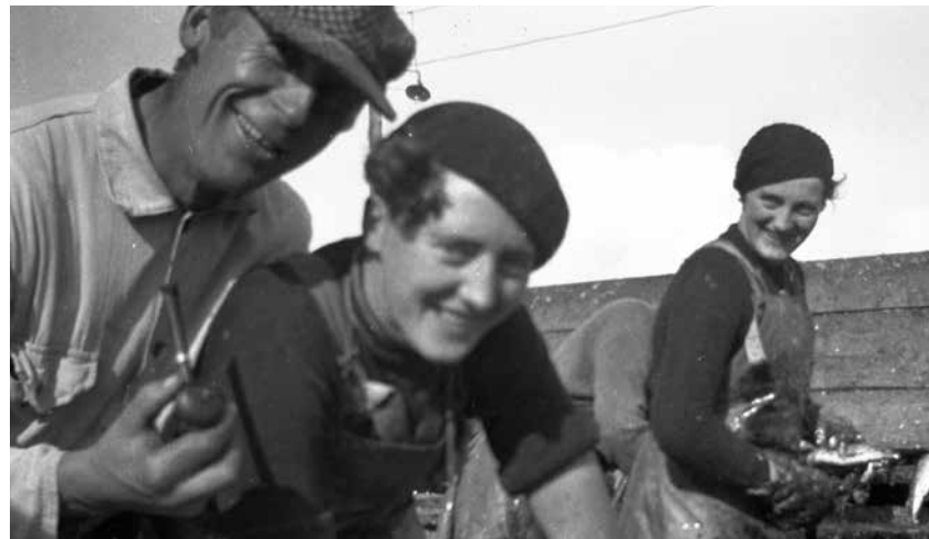
Í síld á Siglufröi.

Héraðsskjalasafn Skagfirðinga reid á vaðið með opnun ljósmyndavefs á vordögum 2012 og er nú unnið að því að bæta við myndum á vefinn skagafjorður.is/myndir. Um er að ræða gerbyltingu þegar kemur að aðgengi almennings að ljósmyndum safnsins. Mikil ánægja er meðal heimamanna með ljósmyndavefinn og þá er ljóst að