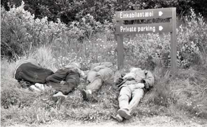
Preyttir gestir eftir Atlavíkurhátíð um verslunarmanna- helgina 1986. Fréttamynd úr Austra.