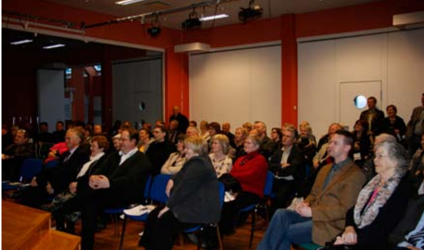
Gestir við opnun á Ljósmyndavef Héraðsskjalasafns Skagfirðinga.

Við skráningu ljósmyndanna hefur komið í ljós hversu mikilvægt það er að þessi vinna sé unnin nú. Stór hluti myndasafna sem geymd eru í söfnunum eru frá tímabilinu frá 1930 – 1960 og fer því fólki ört fækkandi sem getur þekkt myndefni frá þeim tíma. Því höfum við hvatt söfn og eigendur ljósmynda almennt til að leita allra leiða til að ná fram upplýsingum um myndefni, því hér er um að ræða kapphlaup við tímann.