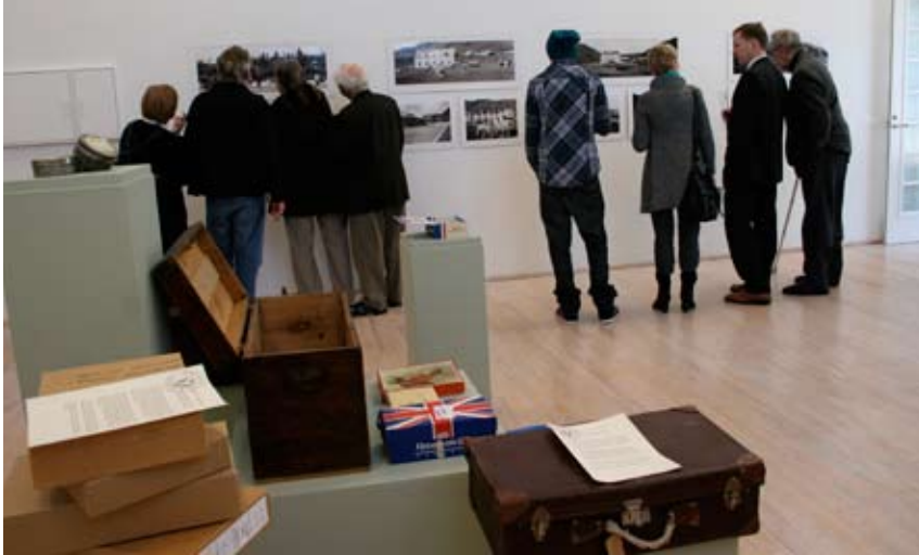
Gestir á opnun ljósmyndasýningarinnar Úr kóssum og koffortum á Listasafni Árnesinga. Í forgrunni eru kassar, koffort, áldósir o.fl. sem ljósmyndirnar voru í þegar þær voru afhentar á skjalasafnið.

Austfirðinga ákvað að biðja með þá framkvæmd en láta duga að sinni að halda reglulegar ljósmyndasýningar á vefsíðu safnsins, auk heimsókna á ýmsa þéttbýlisstaði í fjórðungnum til að sýna ljósmyndir og fá aðstoð við að þekkja þær.