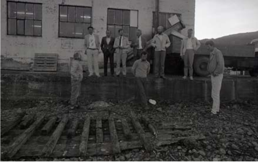
Stjórn og framkvæmdastjóri Kaupfélags Héraðsbúa í vinnustaðaheimsókn á Borgarfirði eystri árið 1984.