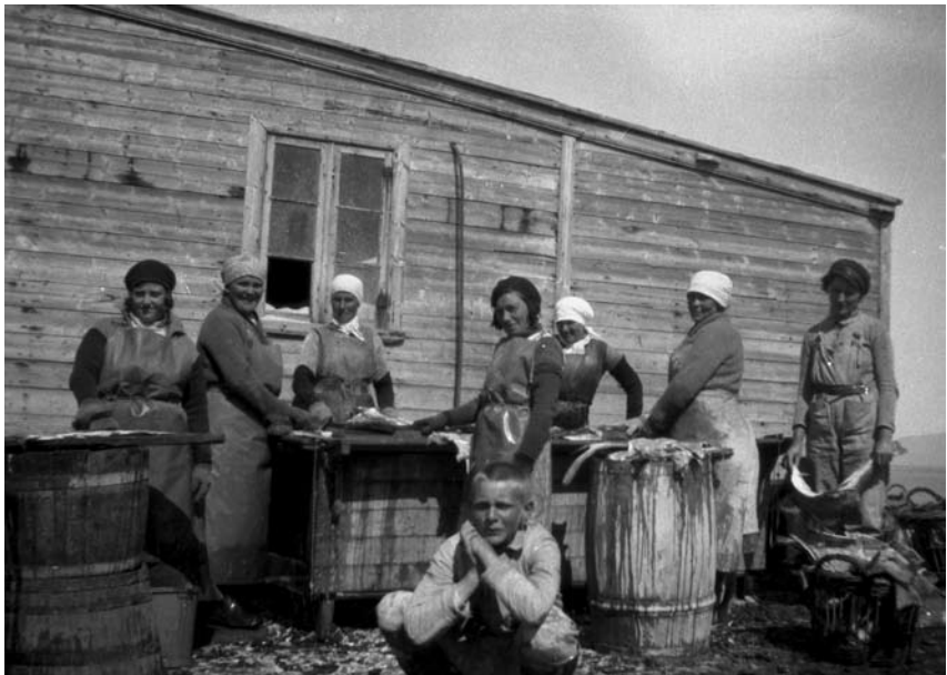
Konur við fiskvinnslu á Sauðárkróki á 4. áratug 20. aldar. Ljósmyndari Kristján C. Magnússon Sauðárkróki: KCM 357.

Gert er ráð fyrir að verkefnið standi undir sér en tekjur þess eru einnig kr. 6.400.000,-. Af þeim koma kr. 5.000.000,- sem framlag frá ríkinu en 1.400.000,- sem framlag frá sveitarfélaginu Fljótssdalshéraði.