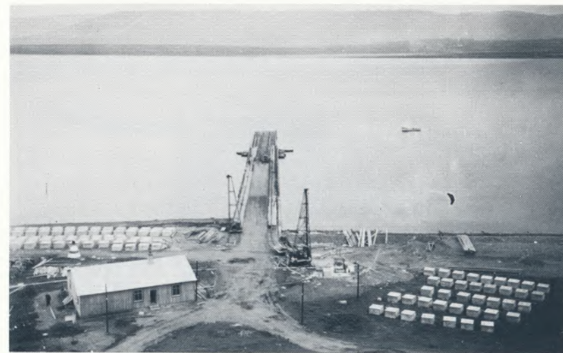
Mynd nr. 1. Frá hafnargerð á Sauðárkróki 1938-1939.

Í Héraðsskjalasafni er allmikið safn svonefndra atburðamynda og myndefnið jafnfjölskrúðugt og athafnir manna gefa ástæðu til. Þessar myndir eru enn að mestu óskráðar, en grófflokkaðar, flestar úr Skagafirði, en þó margar úr öðrum héruðum. Þær hafa annars konar heimildagildi en myndir af mönnum, sem lýsa einkahögum þeirra, fjölskyldu, jafnvel aldarhætti og skapgerð, og einatt nákomnar ættingjum og vinum, og þó hafa sumar mannamyndir öðlazzt hærri sess, vegna þess að ævi og starf einstaklinga hefur borið