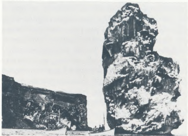
Kerling við Drangey.